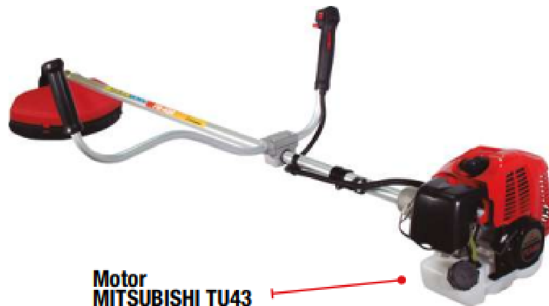
Motor MITSUBISHI TU43

La relación de mezcla es 25:1 para aceite mineral, y 50:1 para aceite sintético ó semisintético.